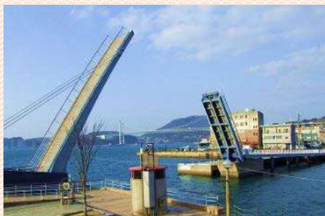
5 ブルーウィングもじ