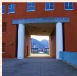
8 プレミアホテル門司港