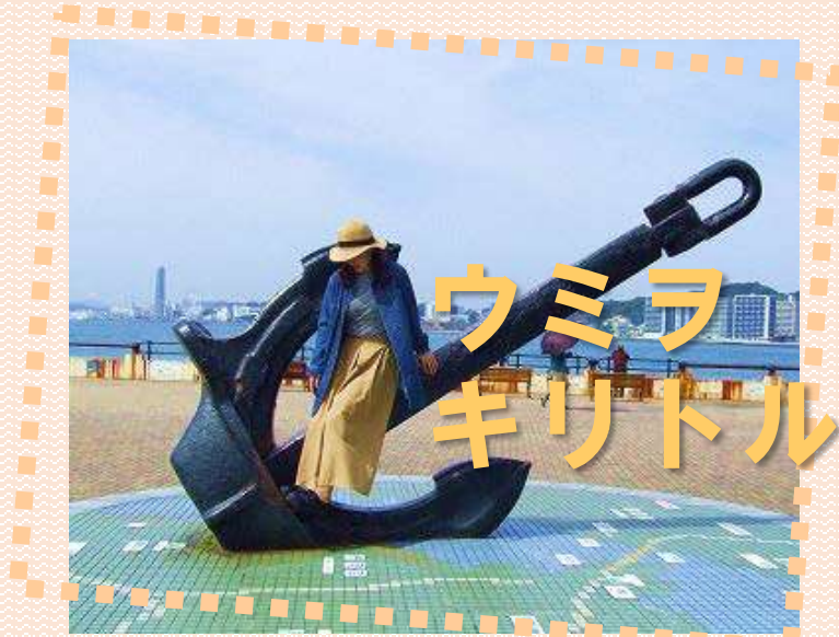
4 ノーフォーク広場