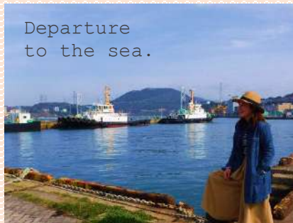
Departure to the sea.