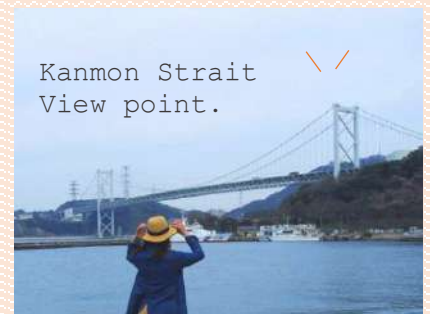
Kanmon Strait View point.