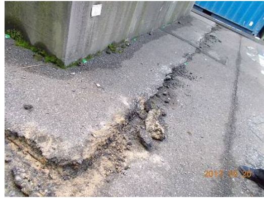
太刀浦第1コンテナターミナル照明塔の下