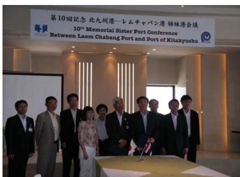
チャラムケット局長（右から 4 人目） 他 5 名が参加