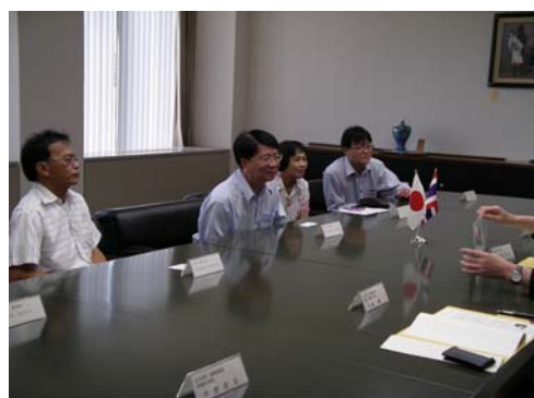
説明に傾聴されるチャラムケット局長