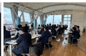
⑧第三部 施設見学 （太刀浦コンテナターミナル）