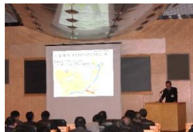
②北九州港 プレゼン