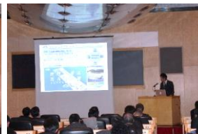
③北九州空港 プレゼン