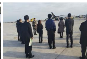
⑦第三部 施設見学 （北九州空港）