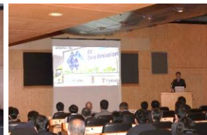
④福岡トランス 講演