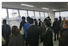
⑥第一部 施設見学 （ひびきコンテナターミナル）