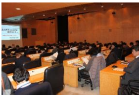
①第二部 セミナー 全景