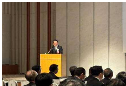
② 佐溝局長プレゼン