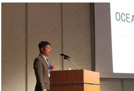
⑤ オーシャントランスプレゼン