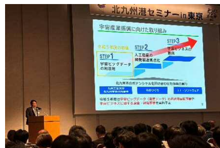
① 武内市長プレゼン