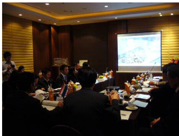
北九州港プレゼンテーション