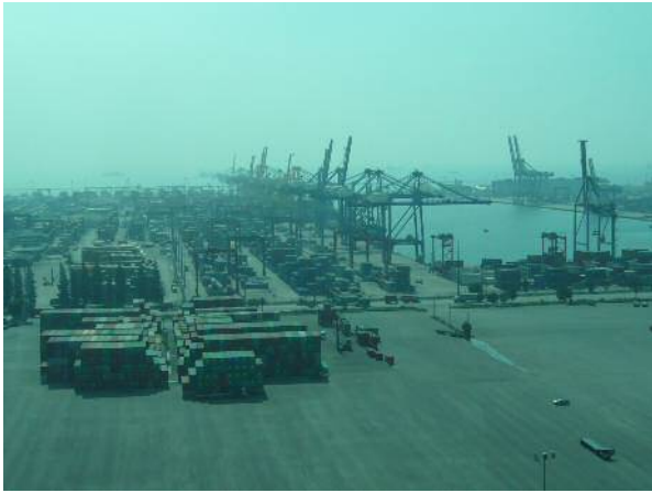
レムチャバン港港湾施設視察