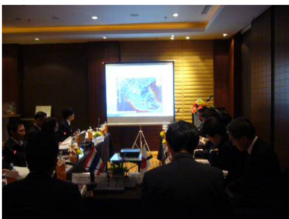
レムチャバン港プレゼンテーション