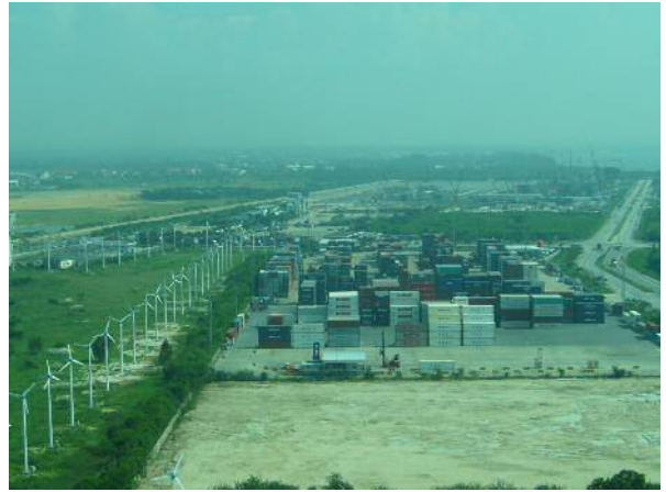
レムチャバン港港湾施設視察