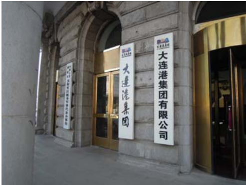
大連港集団ビル玄関