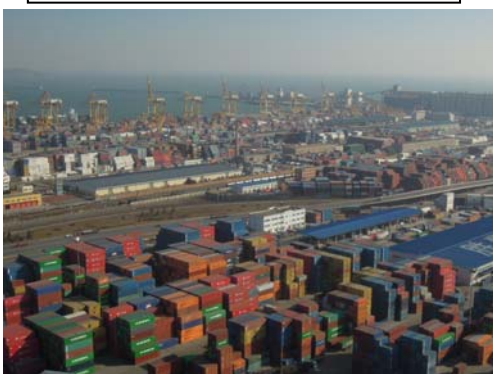
コンテナターミナル 遠景