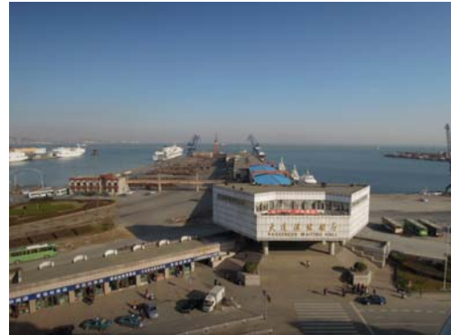
大連港フェリーターミナル