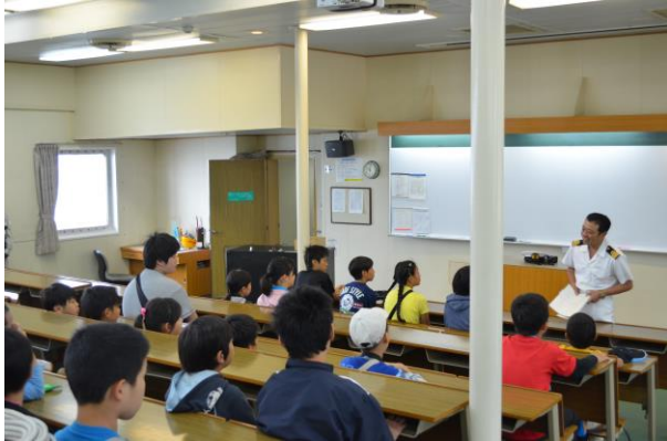
海や船の仕事について楽しく学びました