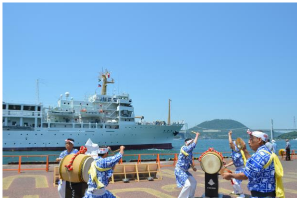
小倉祇園太鼓を披露しました