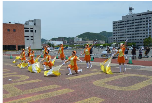
カラーガード隊（キタキューティーズ）の演技