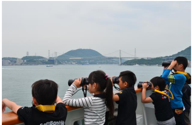
ブリッジから関門海峡を眺めました