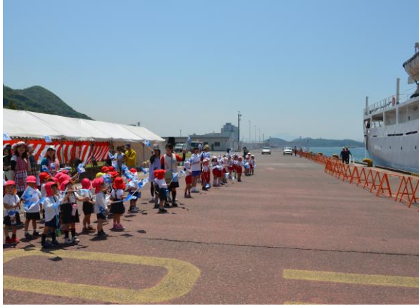
園児もお見送りに駆けつけました