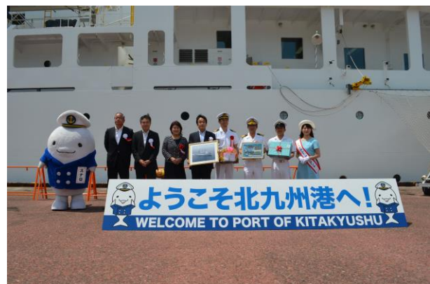
船長・機関長と記念撮影