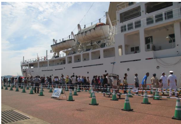
多くの市民や観光客で賑わいました