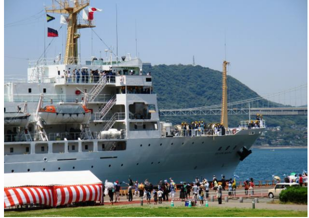
旗を振ってお見送り