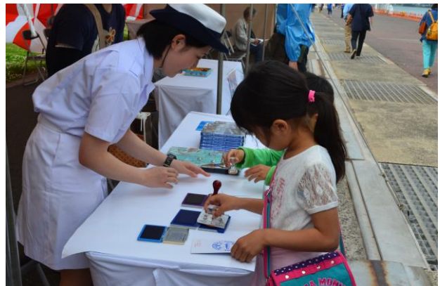
子どもたちに乗船記念証をプレゼント