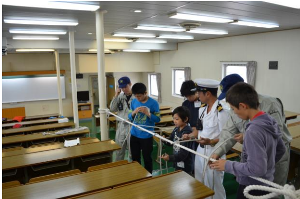
ロープワーク（もやい結び）を体験