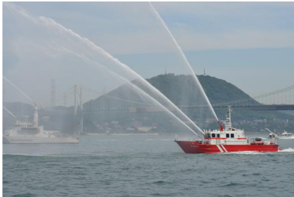
巡視艇・消防艇による歓迎放水