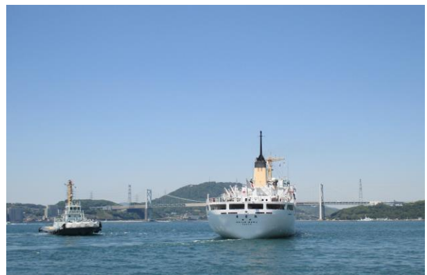
関門海峡を通り神戸港へ出発