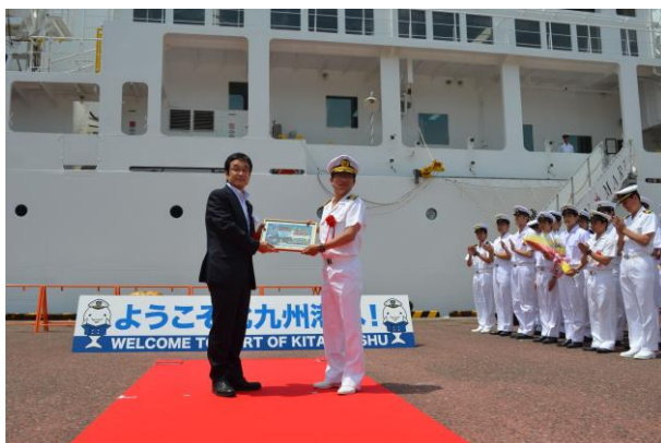
船長へ記念品（スチールアート）の贈呈