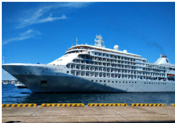
(シルバー・ウィスパー入港)

また、コロナ禍以降では初となる歓迎訪船が行われ、船長をはじめ、クルーと記念品を交換するなど、親睦を深めました。