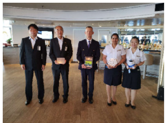
(歓迎訪船 記念撮影)