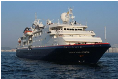
「シルバー・ディスカバラー」 全長：102.97m 総トン数：5,218 t

午後5時、北九州市立緑丘中学校吹奏楽部の華やかなマーチング演奏の後、バルーンリリースで船旅の安全を祈りました。たくさんの市民に見送られ、次の寄港地宮島港に向け出港しました。