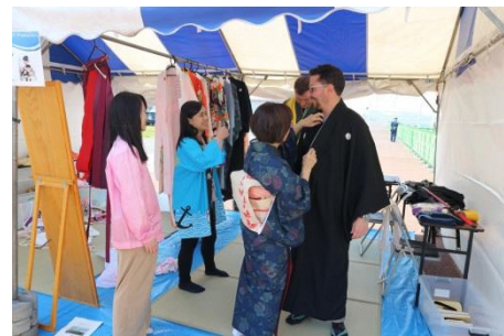
着物の着付け体験は大盛況！