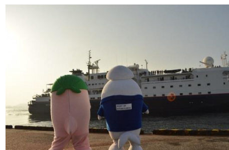
次の寄港地宮島に向け出港