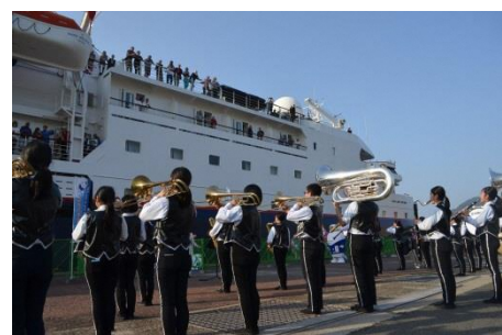
緑丘中学校吹奏楽部の華やかなマーチング演奏